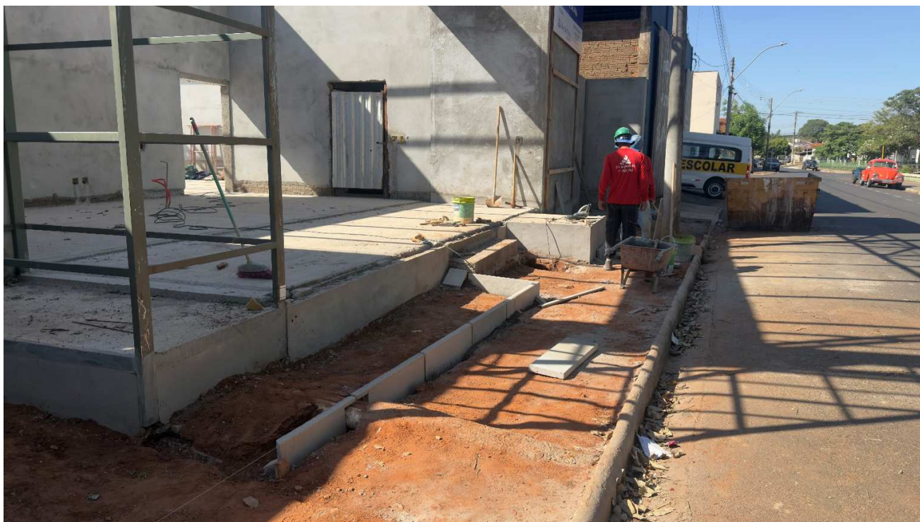
Nova rampa, jardineiras e escada.