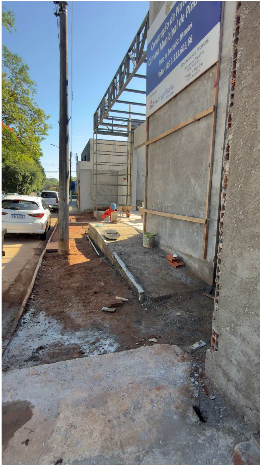
Execução de nova rampa de acesso