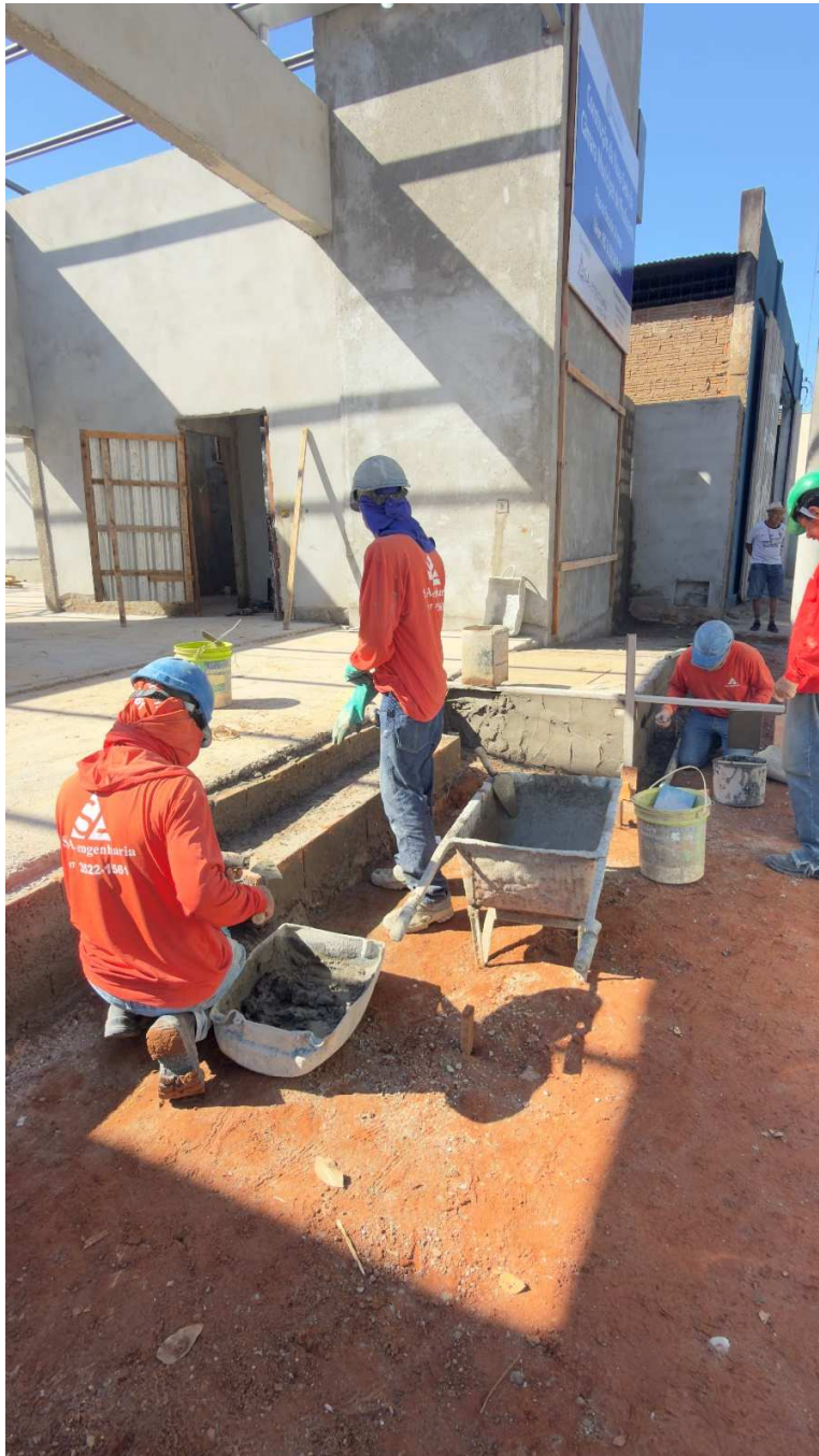
Execução de nova rampa de acesso e nova de escada