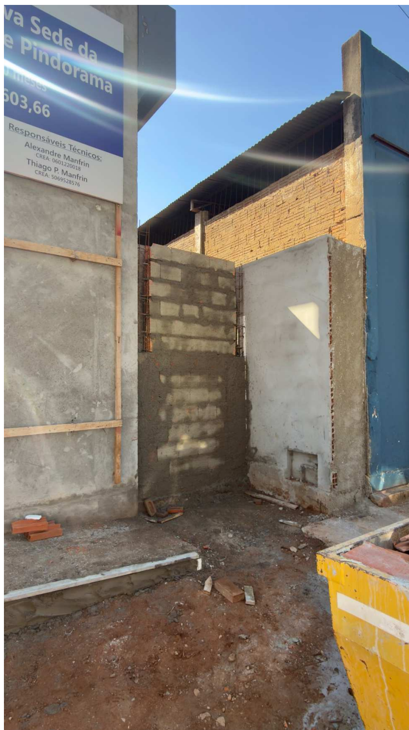
Execução de novo muro de fechamento